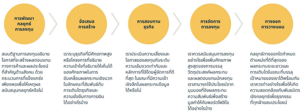
รูปที่ 3: กระบวนการพื้นฐานในการจัดการการลงทุนด้านผลกระทบ

ในฐานะนักลงทุน ท่านมีอำนาจในการประเมินและสร้างอิทธิพลต่อผลกระทบในทุกขั้นตอนของกระบวนการลงทุน ชาร์กนี่มาจากรายงานของ Tideline ที่ชื่อ The Alpha of Impact แสดงให้เห็นจุดที่นักลงทุนเช่น อาคิล อาจสร้างอิทธิพลขึ้นมาได้ โดยทั่วไปแล้วเขาต้องการผลตอบแทนเชิงพาณิชย์นอกเหนือจากผลลัพธ์ที่สร้างผลกระทบได้ด้วย ท่านเห็นได้ว่า ในแต่ละขั้นตอนของกระบวนการลงทุน มีวิธีต่าง ๆ ในการใช้กิจกรรมเพื่อขับเคลื่อนผลลัพธ์ SDG ให้เป็นจริงได้